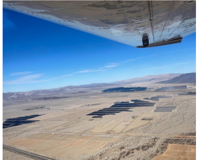
Granja solar vista durante vuelo con ECO FLIGHT.