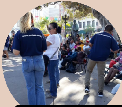
"LA PACITA OLVERA"