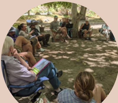
INLAND WORKING GROUP