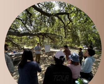
"NO DEJAR RASTRO"

Se sigue dirigiendo el programa con Treepeople de Watertalks. El programa ahora está desarrollando un proyecto en el este de Los Ángeles. El proyecto convirtiera una zona industrial abandonada en un parque para ganar terreno verde donde hay pocos parques. El 26 de mayo, se recorrió 3 áreas donde se proyectaron proyectos para recolectar ideas para los nuevos desarrollos en East LA/ Boyle Heights.