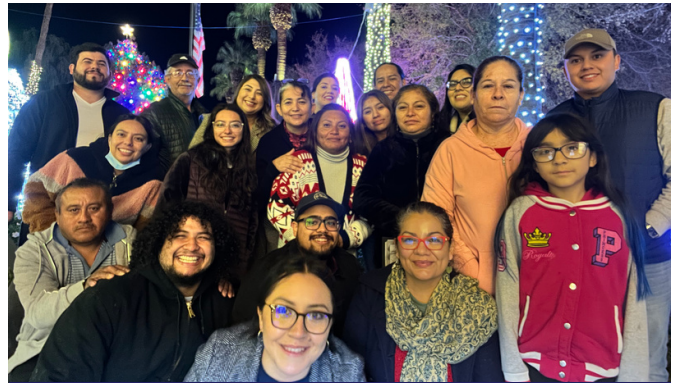
Posada para promotores cívicos y defensores de tierras públicas de Coachella (pt. 1)