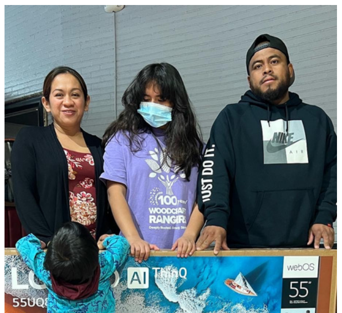
Ganadora de la rifa de TV de 65 pulgadas en la Fiesta Navideña para promotores cívicos