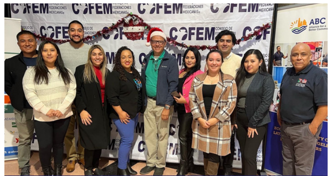
COFEM y otros compañeros de SELA en la Fiesta Navideña para promotores cívicos