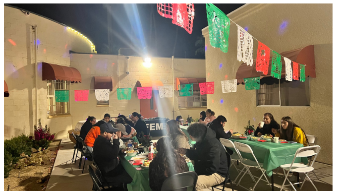
Posada para promotores cívicos y defensores de tierras públicas de Coachella (pt. 2)