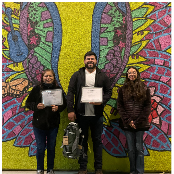
Graduados de la clase de Defensores de Tierras Públicas 2022